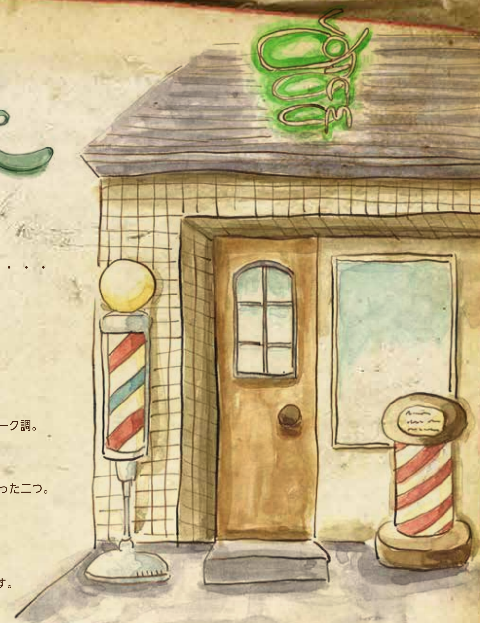
VOICE BARBER HYAKUMANBEN